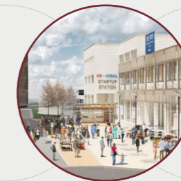
서울시 캠퍼스타운 조성사업 선정