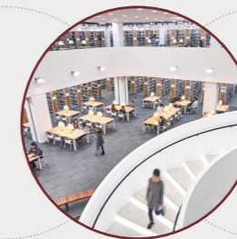
최첨단 ICT기술 갖춘 중앙도서관