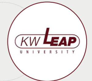
대학혁신지원사업 자율협약대학 선정